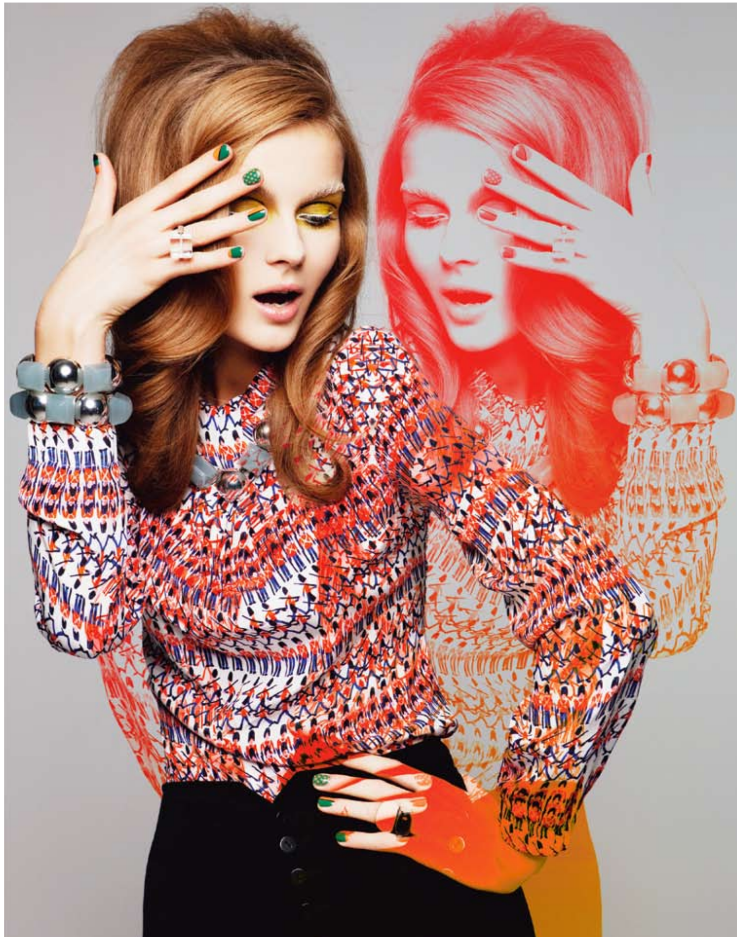
Mönstrad viskosblus, stl XS-L, 2 600 kr, från Peter Jensen. Sammetsbyxa av bomull/lycra, stl XS-L, 450 kr, från Monki. Halsband, armband och ring av plast/metall, 199, 149 respektive 99 kr, från Glitter. Svart ring av silver/onyx, 2 250 kr, från Nina/Sthlm. Vit ring av emaljerat silver, 790 kr, från ck. Mönstrade naglar, 600 kr, målade på salong Naglar på Fridas. Höger sida: Helpisserad klänning av polyester/viskos, stl XS-XXL, 2 895 kr, från Marimekko. Hårspännen av mockaimitation, 60 kr/par, från Monki. Silverpläterade örhängan med Swarovskikristaller, 720 kr, från Viveka Bergström. Plastarmband, 299 kr, från Snö of Sweden. Strumpbyxor, 189 kr, från Vogue. Stövlar av lackat läder, 4 500 kr, från NG by Tero Palmroth.