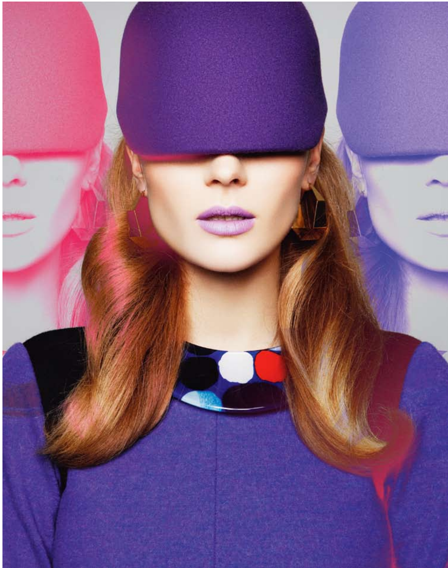
Kortkort ullklänning, stl 34-42, 4 120 kr, från Sonia by Sonia Rykiel. Ullhatt, 695 kr, från Minimarket. Örhängen av guldpläterad koppar/titan, 1 295 kr, från Gold Digger. Plasthalsband, 645 kr, från Marimekko. Höger sida: Rutig kappa av ull/nylon/akryl/polyester, stl XS-L, 4 900 kr, från Henrik Vibskov. Knytblus av polyester, stl XS-L, 1 300 kr, från Carin Wester. Shorts av skinnimitation, stl XS-L, 500 kr, från Monki. Halsband av metall, 398 kr, från Zanzlöza Zmycken. Läderskärp, 495 kr, från Swedish Hasbeens. Strumpbyxor av bomull, 465 kr, från Marimekko. Benvärmare av nylon/akryl/mohair, 249 kr, från Calvin Klein Jeans. Mockasandaletter, 1 199 kr, från Topshop.