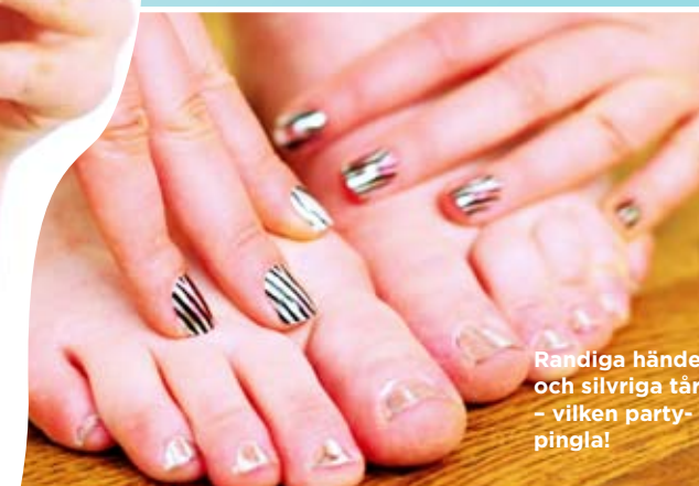
Randiga händer och silvriga tår – vilken party-pingla!